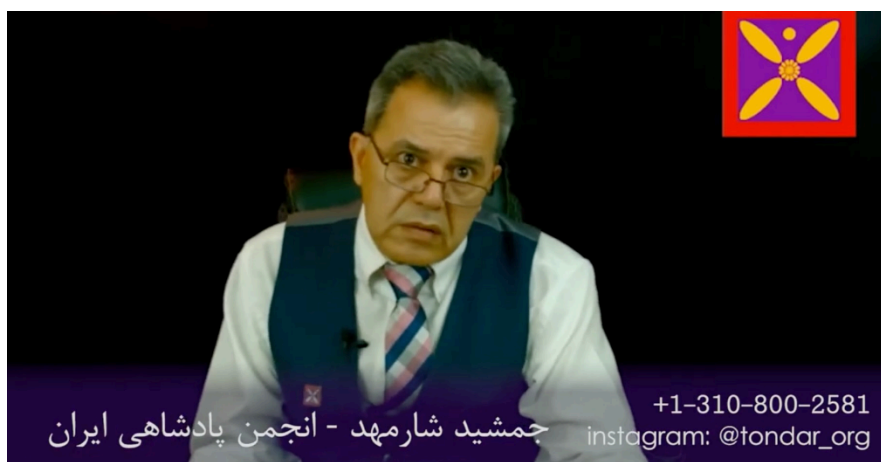
جمشید شارمهد در حال اجرای برنامه تلویزیونی تندر، ۲۳ اردیبهشت ۱۳۹۷.

تنها به عنوان ابزاری برای بیان دیدگاه‌ها و ارتباط با یکدیگر استفاده می‌کنند 10 . او به‌طور مشخص تأکید کرده بود که نه او و نه هیچ‌کس دیگر از این سازمان تاکنون به افراد علاقه‌مند به سازمان‌دهی، دستوری صادر نکرده‌اند و در آینده نیز چنین نخواهند کرد 11 .