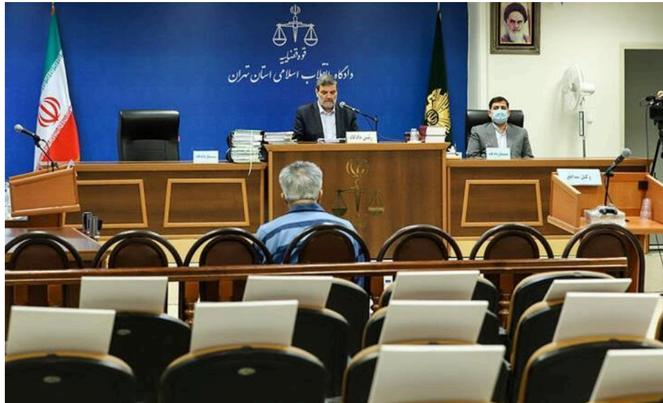
دومین جلسه محاکمه جمشید شارمهد در حضور قاضی ابوالقاسم صلواتی، ۳۰ بهمن ۱۴۰۰.

جلسه پنجم به شنیدن صحبت‌های اعضای خانواده قربانیان بمب‌گذاری اختصاص یافت. در آخرین جلسه، که در تاریخ ۱ شهریور ۱۴۰۲ برگزار شد، دادگاه از جمشید شارمهد خواست تا به سوالات پاسخ دهد. گزارش‌های این جلسات اطلاعاتی در مورد محتوای کیفرخواست ارائه می‌دهند، اما هیچ اطلاعاتی در مورد دفاعیات شارمهد وجود ندارد، جز اینکه گزارش شده که او سعی کرده مسئولیت اعمالی که به او نسبت داده شده را رد کند. 18