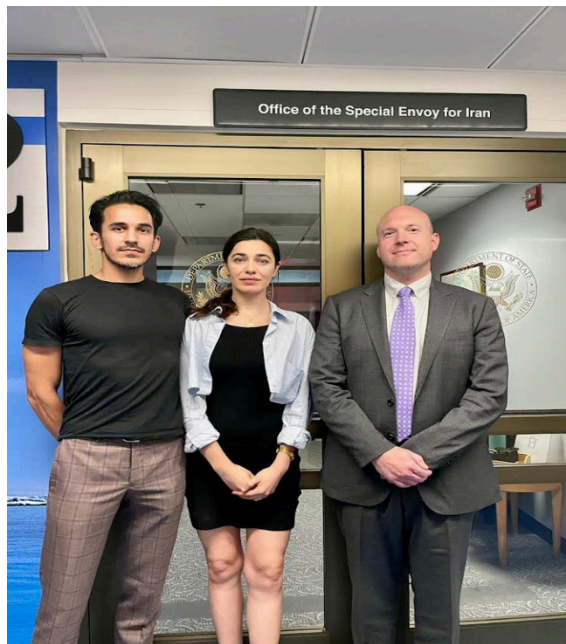
دیدار فرزندان جمشید شارمهد، غزاله و شایان، با نماینده ویژه آمریکا در امور ایران، آبرام پالی، ۴ شهریور ۱۴۰۲.