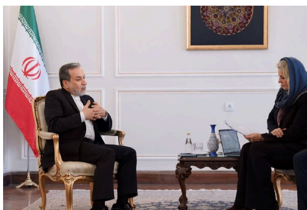
مصاحبه عباس عراقچی با روزنامه اشپیگل - ۱۸ آبان ۱۴۰۳ - خبرگزاری مهر

اظهارات گمراه‌کننده عباس عراقچی، وزیر امور خارجه ایران، در تاریخ ۱۸ آبان ۱۴۰۳ به هفته‌نامه «اشپیگل» نمونه‌ای از این موضوع است. او ضمن ابراز واکنش نسبت به اتهامات مربوط به ناعادلانه بودن محاکمه شارمهد، تاکید کرد که دادگاه یک وکیل برای او تعیین کرده است زیرا «اگرچه به او اجازه داده شده بود که وکیلی انتخاب کند، اما او از انجام آن امتناع کرد.» او همچنین تصریح کرد که ایران هیچ مشکلی با بازگرداندن جسد آقای شارمهد و انجام کالبدشکافی آن ندارد، مشروط به اینکه خانواده درخواست مربوطه را ارائه دهند 39 .