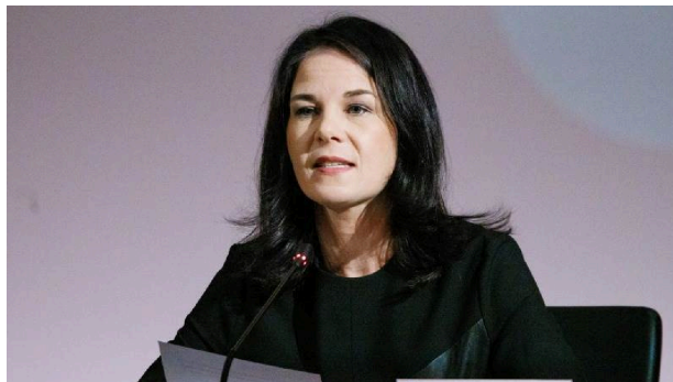
آنالنا بانربوک، وزیر امور خارجه آلمان – ۱۱ آبان ۱۴۰۳ - تونسپانیوز

پس از اعدام جمیشید شارمهد، آلمان سه کنسولگری ایران در این کشور را بست 36 و وزیر امور خارجه آلمان، آنالنا بانربوک، روابط دیپلماتیک میان دو کشور را در «نقطه‌ای پایین‌تر از حد معمول» توصیف کرد. بانربوک گفت: «ما بارها و به طور قاطع به تهران توضیح داده‌ایم که اعدام یک شهروند آلمانی پیامدهای جدی خواهد داشت.» پیش از این، اعلام حکم اعدام آقای شارمهد منجر به اخراج دو دیپلمات ایرانی از آلمان شد 37 . این اقدامات تشویق‌کننده و مؤثر هستند، اما در بلندمدت کافی نخواهند بود تا جمهوری اسلامی را متوقف کند.