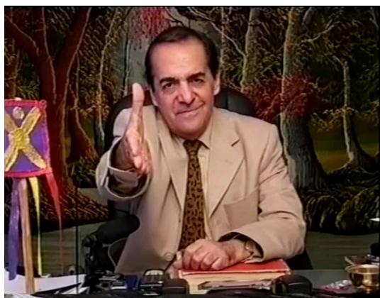
دکتر فرود فولادوند. آواتودی

در سال ۱۳۸۵، جمشید شارمهد وبسایتی به نام tondar.org برای فولادوند ایجاد کرد تا برنامه‌های تلویزیونی او را آرشیو کند. در ۲۸ دی ۱۳۸۵، فولادوند به همراه دو نفر از حامیانش، الکساندر والی‌زاده (شهروند ایرانی/آمریکایی) و ناظم اشمیت (شهروند ایرانی/آلمانی)، در یوکسک‌اوا (یک منطقه در استان حکاری ترکیه، نزدیک به مرز ایران) ناپدید شدند. گمان می‌رود این افراد توسط عوامل جمهوری اسلامی ربوده شده‌اند. 8 تاکنون محل دقیق اختفای آن‌ها مشخص نشده است. همچنین خودروی کرایه‌ای فولادوند در ترکیه در حالی پیدا شد که شیشه‌های آن شکسته، سیم‌کشی‌ها بریده و پلاک‌های آن برداشته شده بودند.